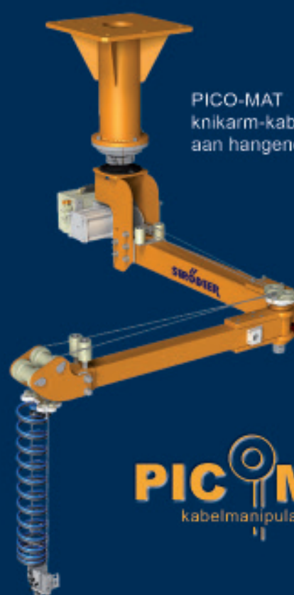
PICO-MAT knikarm-kabelbalancer aan hangende kolom