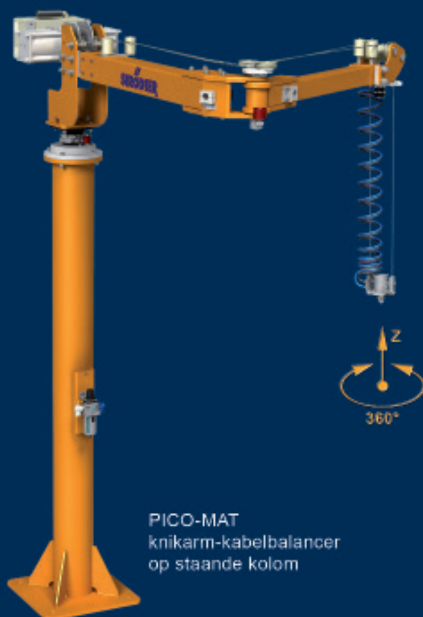
PICO-MAT knikarm-kabelbalancer op staande kolom